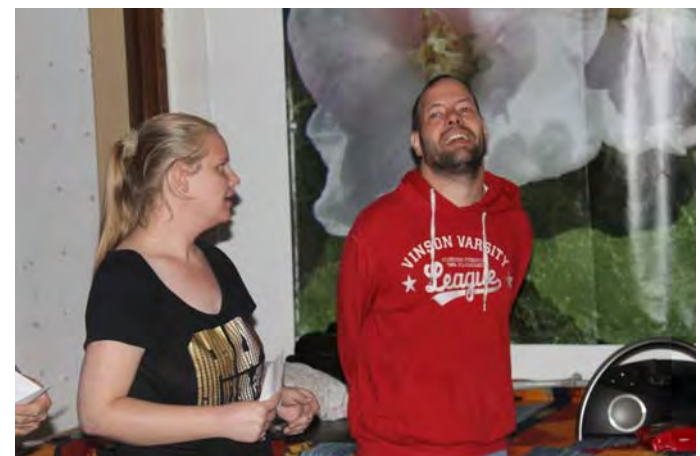
Und gemeinsame Pläne für 2015